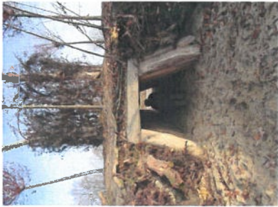
Acacia tunnel met uitgang